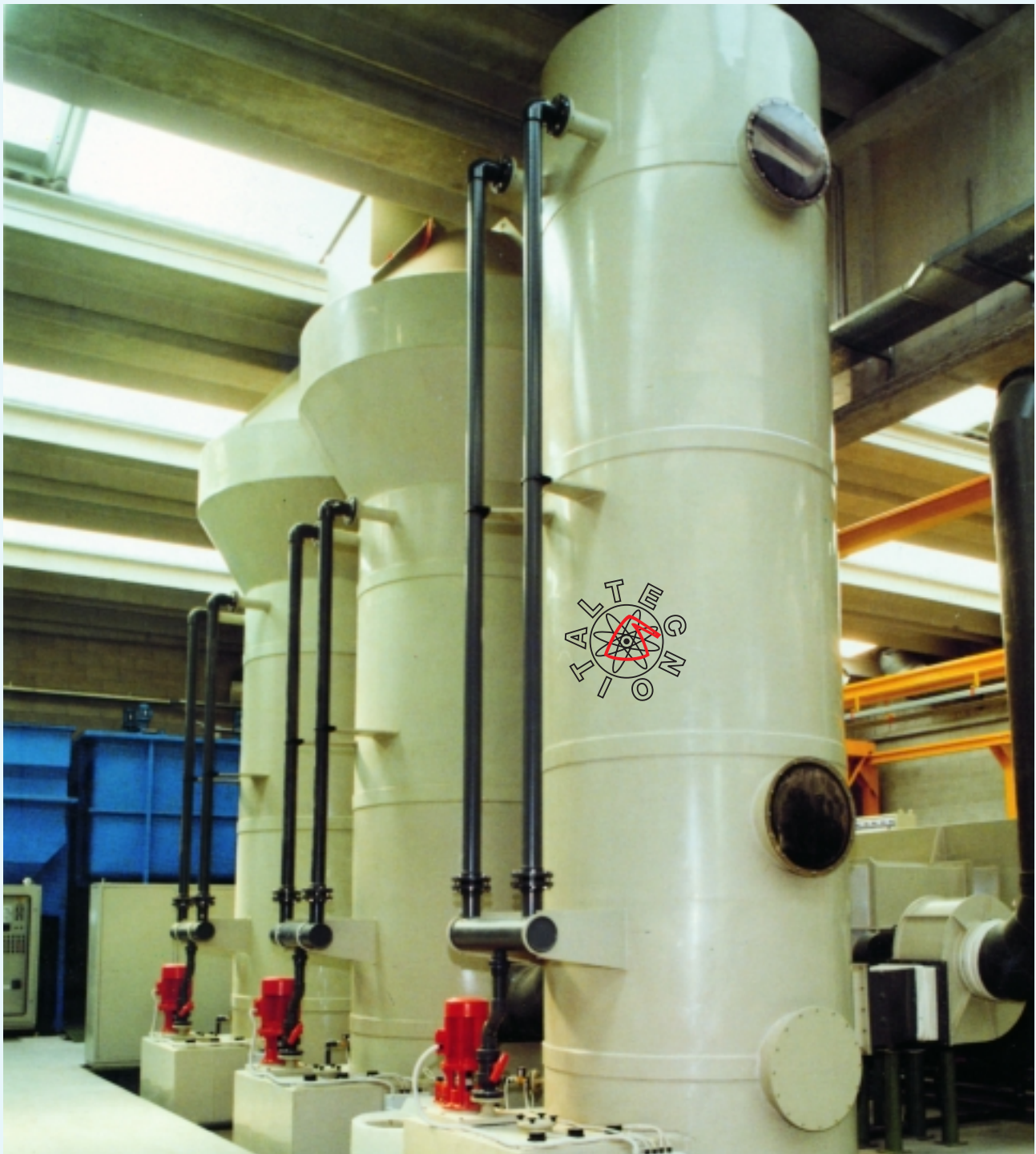
Esempio di torri di neutralizzazione per espulsione di fumi trattati, in conformità alle leggi vigenti