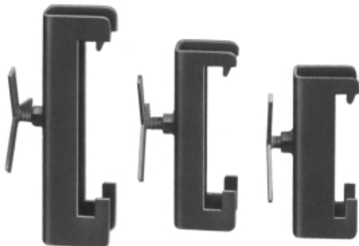
Morsetto tipo A: a doppio bloccaggio e a serraggio a vite