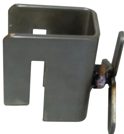
Morsetto tipo B: a bloccaggio singolo e a serraggio a vite